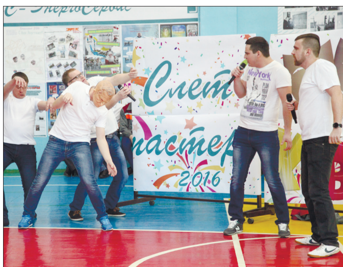
Конкурс КВН. Команда ООО «Электро-ЭнергоСервис».