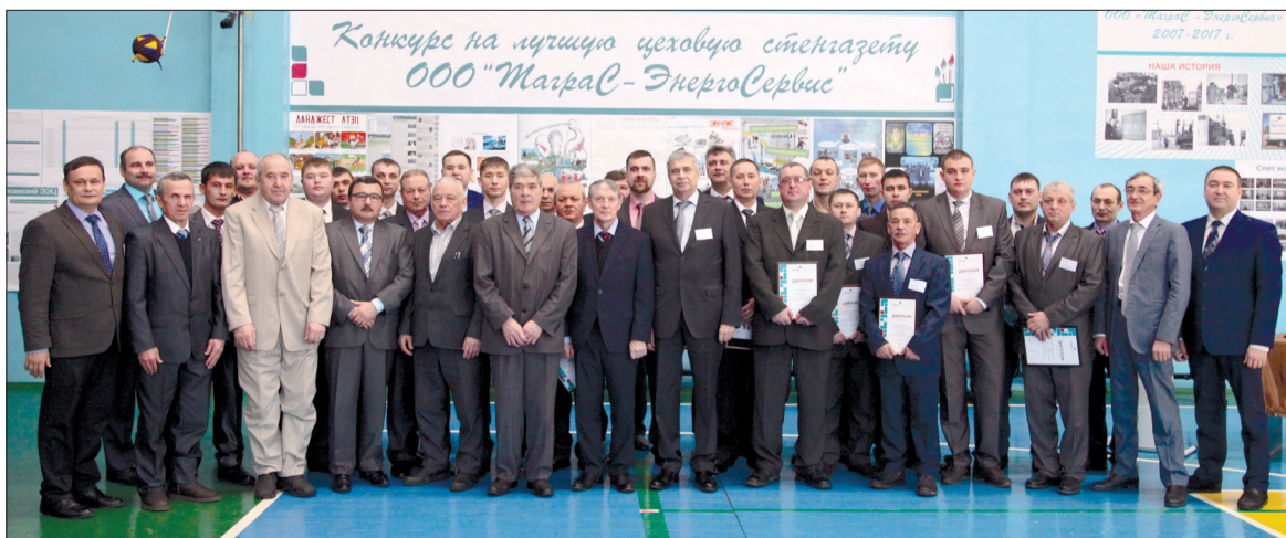
На фото: ветераны Компании и победители конкурса «Лучший мастер ООО «Таграс-ЭнергоСервис»

Пусть всегда и везде Вам сопутствует успех в делах и удача во всех начинаниях. Мира, добра и благополучия Вам и Вашим семьям.